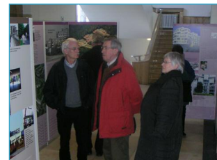
Konzeption einer multimedialen Ausstellung