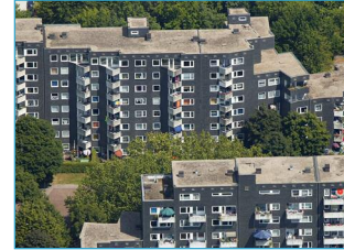
Das städtebauliche Modellvorhaben "Neue Stadt"