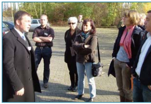
Sprechstunden der Diakonie und weitere Angebote in einer umgenutzten Wohnung

chungskameras an den Hauseingängen für eine höhere Sicherheit installiert und Renovierungsarbeiten in Fluren sowie die Umgestaltung der Eingangsbereiche für mehr Transparenz umgesetzt. Ergänzend dazu wurden bessere Beleuchtungsanlagen und Fahrradständer im Außenraum installiert.