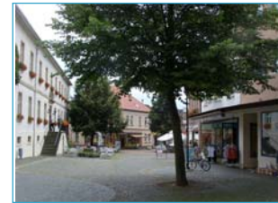
Gestalterische Defizite in der Steinheimer Innenstadt

Insgesamt fehlt es der Innenstadt jedoch vielerorts an einer einheitlichen, attraktiven Gestaltung des öffentlichen Raums. Diese gestalterischen Defizite wirken sich auch negativ auf die Attraktivität der Innenstadt als Einkaufs-, Gastronomie- und Freizeitstandort aus. Daher ist die Neu- beziehungsweise Umgestaltung des öffentlichen Raums im Steinheimer Zentrum eine der bedeutendsten Maßnahmen des Steinheimer Stadtumbaus.