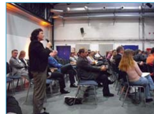
Externe Moderation, gute Kommunikation und klare Ziele sind wichtig im Prozess